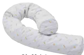
スネーククッション