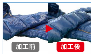
※ダウン衣類のみお預り可能なオプションです。

通常価格 クリーニング料金 + 1,100円(税込) ▼ クリーニング料金 + 550円(税込)